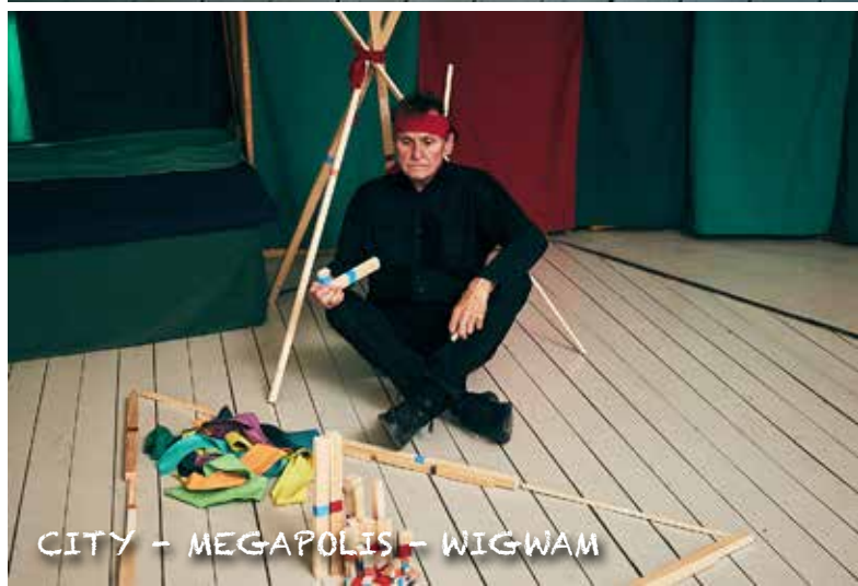
CITY - MEGAPOLIS - WIGWAM