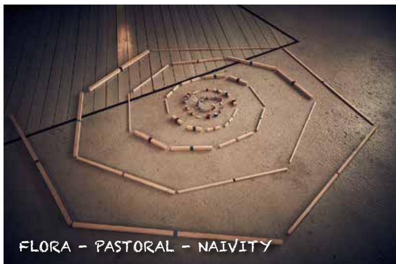
FLORA - PASTORAL - NAIVITY