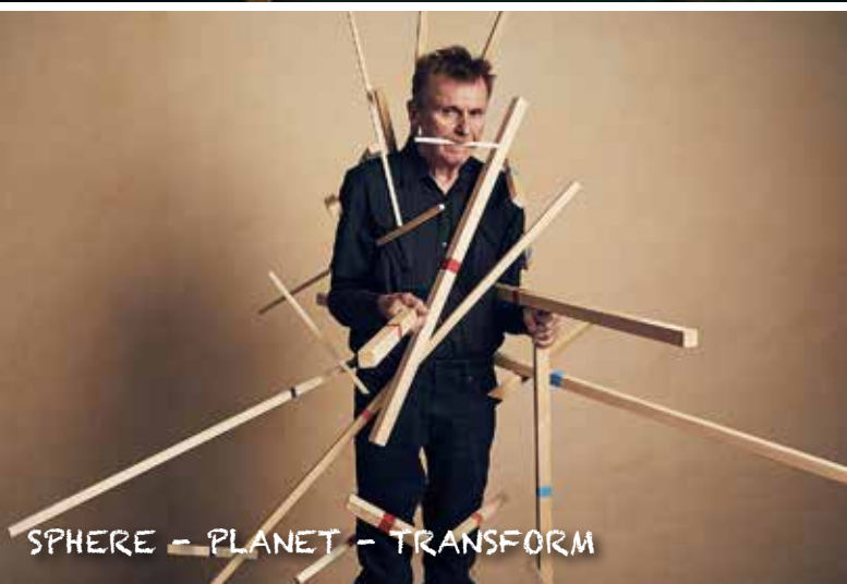
SPHERE - PLANET - TRANSFORM