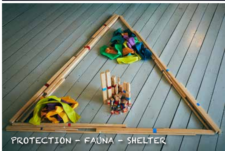
PROTECTION - FAUNA - SHELTER